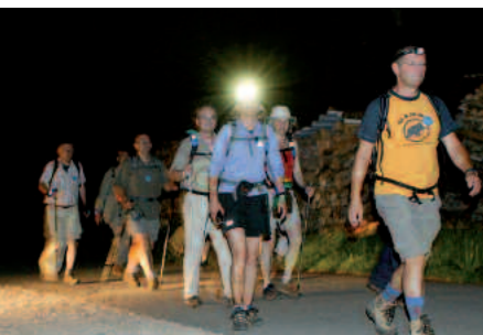
Unerschrocken: Stimplampen weisen den Biosphären-Wanderern den Weg durch die wilde, dunkle Trailfinger Schlucht.

schmack auf das anspruchsvolle Profil. Es galt, einen eigenen Rhythmus zu finden, auf schmalen steilen Pfaden, sich auszutauschen mit denen, die letztes Jahr schon Erfahrungen sammelten. Nicht selten war ein ungläubiges Kopfschütteln zu sehen, bei der Vorstellung bis am nächsten Morgen zu gehen und zu gehen. Schritt für Schritt. Wie soll das funktionieren? Die minutengenaue Punktlandung am Wanderheim auf der Eninger Weide zur ersten Pause lieferte eine Antwort. Der Zeitplan, den Streckenchef Eberhardt ausgetüfelt hatte, war Gesetz und Stütze, eine Richtschnur, an der wir Wanderer uns orientieren konnten.