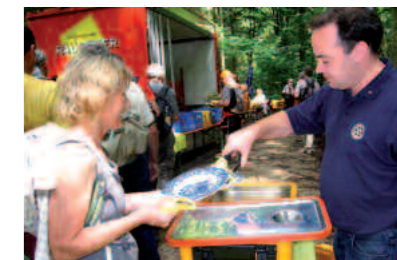
Delikat: Ein üppiges Buffet empfängt die hungrigen Wanderer.

Schon der erste Wegabschnitt hinauf zur Eninger Weide, dem erhabenen Wiesenplateau, lieferte den ersten Vorge-