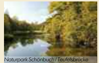
Naturpark Schönbuch / Teufelsbrücke

Modelllebensraum für Mensch und Natur. Mindestgröße: 30 000 Hektar. Kern- und Pflegezone müssen mindestens 3 % und 10 % einnehmen, die Entwicklungszone mindestens 50%.