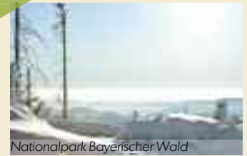
Nationalpark Bayerischer Wald