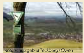
Naturschutzgebiet Teckberg / Owen

Keine Größen- und Zonenvorgabe. Umweltgerechte Landnutzung wird angestrebt. Naturparke eignen sich für Erholung und sanften Tourismus.