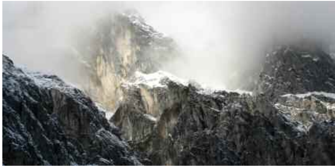
Gebirge rund um den Watzmann – Nationalpark Berchtesgaden

Der Geist seiner Rede an den Präsidenten der Vereinigten Staaten von Amerika im Jahre 1885 überdauerte Wirtschaftskrisen, Kriege und Währungsreformen. Sein Stamm der Duwamish aber büßte in einem billigen Reservat die Menschenwürde ein, ebenso wie die gottgegebene unendliche Freiheit und Selbstbestimmung – und dies bei den Vätern der Demokratie? Analog zum Schicksal der Ureinwohner Amerikas kann sich auch die ursprüngliche