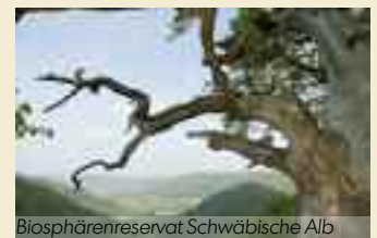
Biosphärenreservat Schwäbische Alb

Festgelegt ist die Mindestgröße von 10 000 Hektar. Nationalparke müssen nach einer mehrjährigen Anlaufphase eine Gliederung in Kernzone (75%) und Pflegezone (25%) aufweisen.