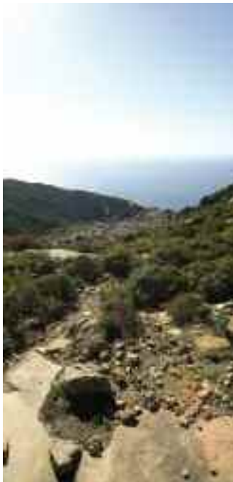
Insel Elba – Nationalpark des Toskanischen Archipels

Während Biosphärenreservate das nachhaltige Wirtschaften im Einklang mit der Natur erproben,