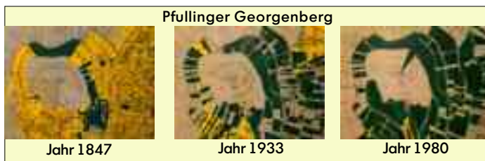
Wein statt Wasser: Die Karte zeigt, dass Weinbau (gelb) nicht nur das Pfullinger Trinkverhalten prägte, sondern auch die Landschaft.