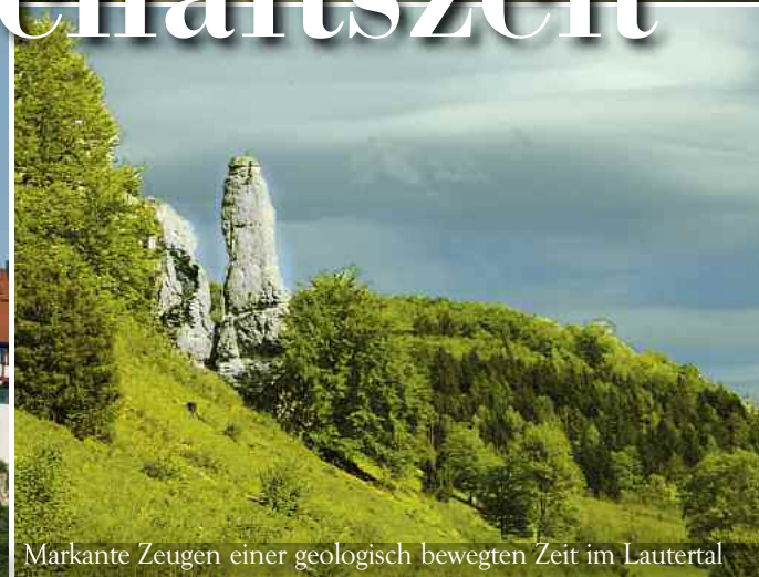
Markante Zeugen einer geologisch bewegten Zeit im Lautertal

Ein Stück Vergangenheit wartet hinter dem Torbogen der Burg Derneck. Kinder stürmen – sie verstecken sich und lauern in spielerischer Ritterpose zwischen den Mauerresten. Ein kleines Abenteuer erwartet die Radler, die sich hier Zeit nehmen für ein Vesper oder gar eine Übernachtung.