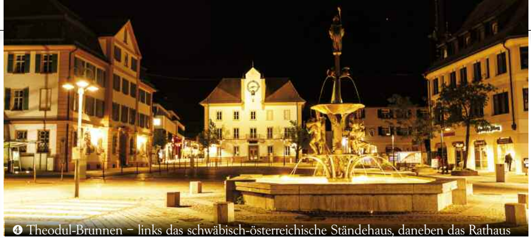
④ Theodul-Brunnen – links das schwäbisch-österreichische Ständehaus, daneben das Rathaus

Achten Sie auf Bierkulturstadt-Wegweiser (Foto ③). Zu 14 besonders interessanten Punkten holt die kostenlose Ehingen App informative und witzige Audiodateien aufs Smartphone oder Tablet (einfach QR-Codes an Besichtigungsschildern einlesen). Dieser Service funktioniert bei Tag und eben auch zur Winternacht, wenn die Sonne viel zu früh in der Donau versinkt. ■ fe