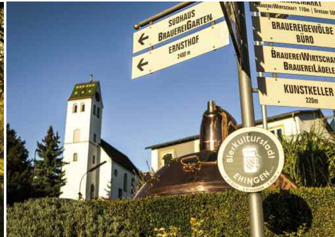
❸ Berg-Brauerei – ein alter Eiskeller kann besichtigt werden

Die Tage werden kürzer, verdammt kurz. Doch Erlebniswanderer machen aus der Not eine Tugend. Sie beobachten Schritt für Schritt das Farbenspiel der Dämmerung im Donautal südlich vor den Toren Ehingens (Foto ❶). Anschließend schlendern sie aus der feuchten Kühle der sumpfigen Auen hinauf ins Orangerot der Straßenlaternen. Die Altstadt igelt sich ein in die Stille eines langen Winterabends. Was gibt es da Schöneres, als den Nachtausflug in der Behaglichkeit eines urigen Gasthauses zu beschließen?