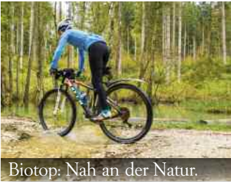
Biotop: Nah an der Natur.

stadt-Scherzone genannt, verschiebt sich ruckartig im Grundgebirge fünf bis zehn Kilometer unter der Erdoberfläche, so dass die heute rund 45 000 Einwohner der neun Stadtteile ständig mit Erdbeben rechnen müssen – jüngst am 19. Februar 2022 mit gemäßigten 3,3 [Magnitude auf der Richterskala]. Die drei großen Beben in den Jahren 1911, 1943 und am 3. September 1978 dagegen verwüsteten Häuser und Stadtteile bei einer Bebenstärke von 6,1 dann 5,6 und 5,7.