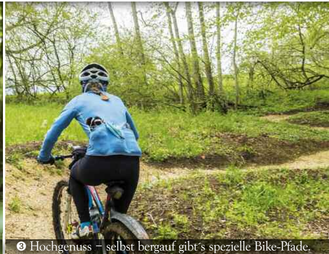
❸ Hochgenuss – selbst bergauf gibt's spezielle Bike-Pfade.

Albstadts Bullentäle ist bei Mountain-Bikern weltweit ebenso bekannt wie das Wembley-Stadion bei Fußball-Fans. Denn: Seit 2013 treten hier die internationalen Bike-Profis bei einem großen Worldcup-Spektakel kraftvoll in die Pedale. Zehntausende Zuschauer fiebern leidenschaftlich jährlich diesem Termin im Mai entgegen.