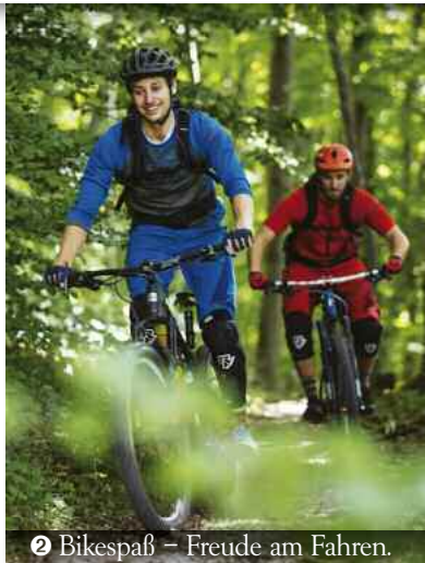
❷ Bikespaß – Freude am Fahren.

Ein Fast-1000er stellt sich in den Weg. Doch nicht nur der 955 Meter hohe Aussichtspunkt Torfels treibt das Adrenalin auf der neuen „Cube Rocks-Tour“ in die Höhe. Vielmehr sind es die angelegten Trailabschnitte. Sie wecken Lust und Neugier auf eine radsportliche Alb.