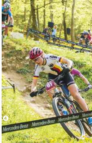
Sport: Worldcup im Bullentäle

Als Sahnehäubchen des sportlichen Potpourris am Bike-Standort Albstadt gilt das Worldcup-Wochenende im Mai (Foto links). Danach lockt im Juni die Breitensportliche Country Tourenfahrt, bei der 2019 457 Biker vier Streckenlängen bewältigten von 29 bis 98 Kilometer. Im Juli folgt der Albstadt-Bike-Marathon. Nächstes Jahr am 10. Juni 2023 findet die Premiere des 1. badkap-Triathlon statt, mit radeln und laufen auf Waldwegen. Tipp: Alle TV-Übertragungen der Worldcups in Albstadt gibt's in der Mediathek von Redbull-TV.