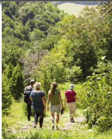
2 Wanderglück: in geschützter Natur.

Sie fließt nach Osten – die Fils. Dann aber wieder zurück nach Westen. Dazwischen liegt ein von kleinsten Tälern zerklüftetes Stück Schwäbische Alb. Das Besondere: An einem der abgeflachten Tafelberge strahlt ein botanisches Kleinod mit der Sonne um die Wette.