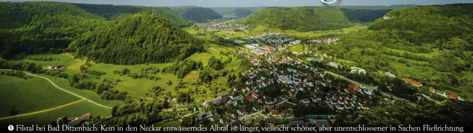
1 Filstal bei Bad Ditzgenbach: Kein in den Neckar entwässerndes Albtal ist länger, vielleicht schöner, aber unentschlüssener in Sachen Fließrichtung.

Sie fließt nach Osten – die Fils. Dann aber wieder zurück nach Westen. Dazwischen liegt ein von kleinsten Tälern zerklüftetes Stück Schwäbische Alb. Das Besondere: An einem der abgeflachten Tafelberge strahlt ein botanisches Kleinod mit der Sonne um die Wette.