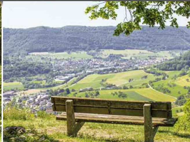
3 Pausenbänke: Filstal-Blick auf Reichenbach und Deggingen.

Filstal, Reichenbach im Täle, Hexensattel – dies sind die drei Marksteine für eine Anreise zu einer der schönsten Wanderungen auf der Schwäbischen Alb. Das Ziel: Ein botanisches Kleinod, auch NSG Nummer 1175 genannt. NSG heißt Naturschutzgebiet, 1175 beziffert als behördlicher Zahlencode das Naturidyll um die beiden Anhöhen Haarberg und Wasserberg (Foto 2). Laut amtlichem Schutzgebietssteckbrief befindet sich dort in südwestlicher Hanglage eine „vielfältige, kleinstrukturierte Landschaft“ geprägt von „Step-