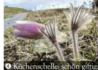
4 Küchenschelle: schön giftig.

Dass inmitten dieses märchenhaften Landstrichs auch eine Passhöhe namens Hexensattel liegt, erscheint daher nun mehr logisch als verwunderlich. Denn teuflisch steil geht es mit 15 Prozent von Reichenbach im Täle auf diesen schmalen Gebirgsgrat hinauf und ebenso bodenlos hinunter ins Örtchen