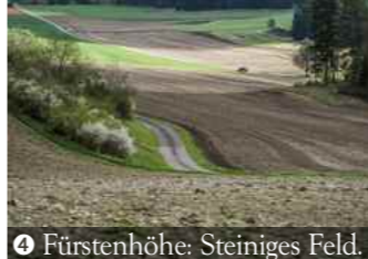
4 Fürstshöhe: Steiniges Feld.

Doch zurück zum 3-Täler-Traum: Ein Technikfossil wartet in Veringendorf: Ein Wasserkraftwerk, eines der ältesten Elektrizitätswerke Deutschlands. Es lieferte schon ab 1902 Strom über eine 15 Kilometer lange Leitung zu Albstadt-Ebingens Textilfabriken. Einheimischen ging erst 1916 ein Licht auf. Sie fürchteten Elektrizität als „Teufelszeug“. Im weiteren Streckenverlauf wogt dann zwischen Lauchert- und Schmeietal eine idyllische Wald- und Wiesenlandschaft zur Fürstshöhe hinauf (4) und hinunter nach Ober- und Unter-