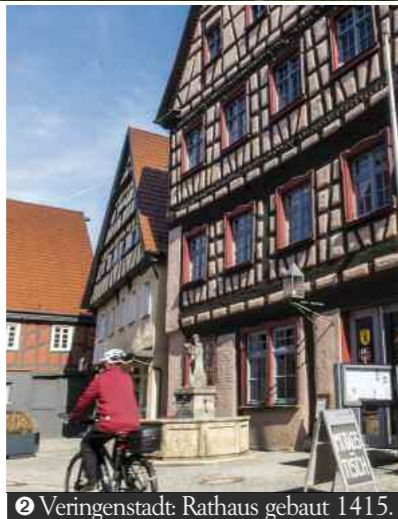
2 Veringenstein: Rathaus gebaut 1415.

Viele kennen das Radwegparadies Naturpark Obere Donau. Spektakulär fräst sich dort der Europafluss westlich von Sigmaringen durch die Alb. Weniger populär: Die Lauchert umschlingt das Kleinod Veringenstein, still mäandriert die Schmeie in ihrem einsamen Tal.