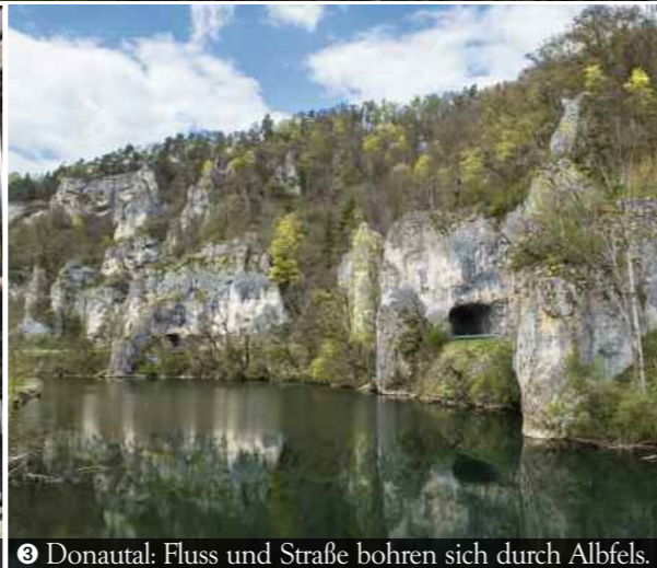
3 Donautal: Fluss und Straße bohren sich durch Albfels.

Hohenzollergraben, Lauchertgraben, Trockentäler, Donaudurchbruch und massenhaft Höhlen. Das hört sich an wie eine Zeitreise zu uralten Geschichten der Schwäbischen Alb. Doch keine Sorge, diese Tour blickt nicht mit streng wissenschaftlicher Brille auf ihre geologischen Extravaganzen, die entstanden, als noch wohltemperiertes Meerwasser über die heutigen Gipfel wogte. Nein, sie präsentiert eine weltliche Ansicht, eine köstliche, quasi ein Dreigangmenü, anstrengend für Leib und erholend für die Seele. Denn: